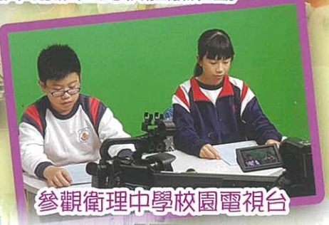
參觀衛理中學校園電視台