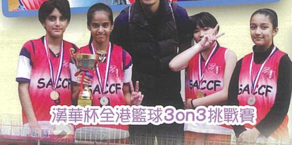
漢華杯全港籃球3on3挑戰賽