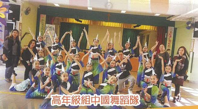
高年級組中國舞蹈隊