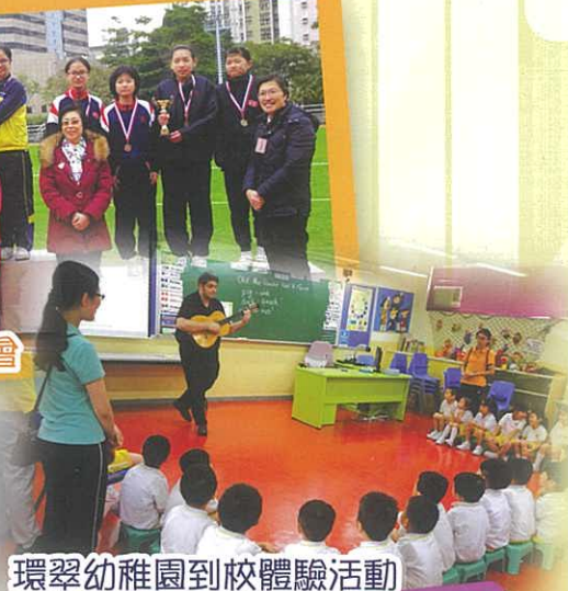
環翠幼稚園到校體驗活動