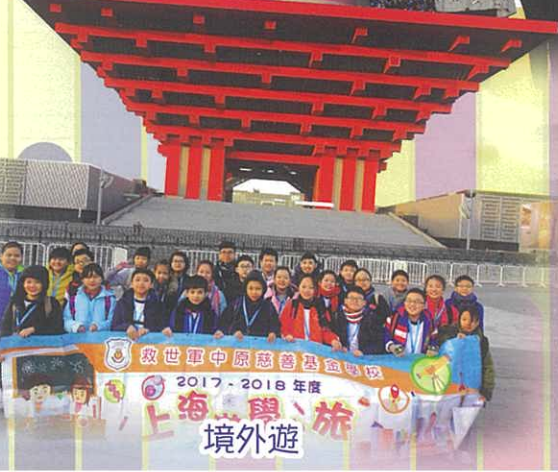
救世軍中原慈善基金學校 2017-2018 年度 上海「學、旅」 境外遊