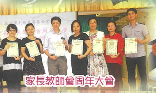
家長教師會周年大會