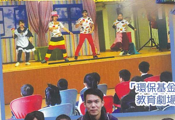
「環保基金」 教育劇場