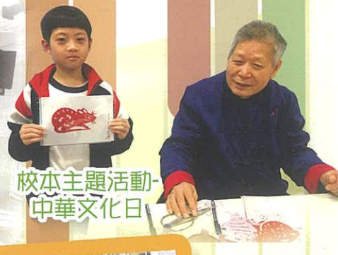
校本主題活動- 中華文化日