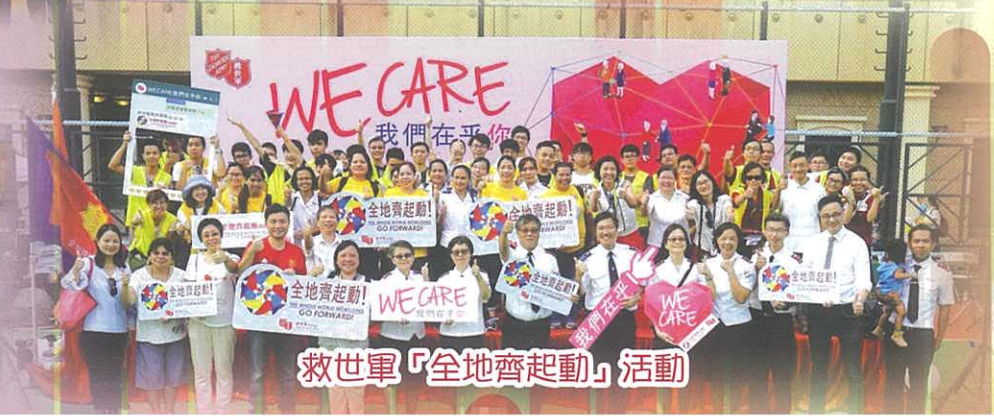
救世軍「全地齊起動」活動