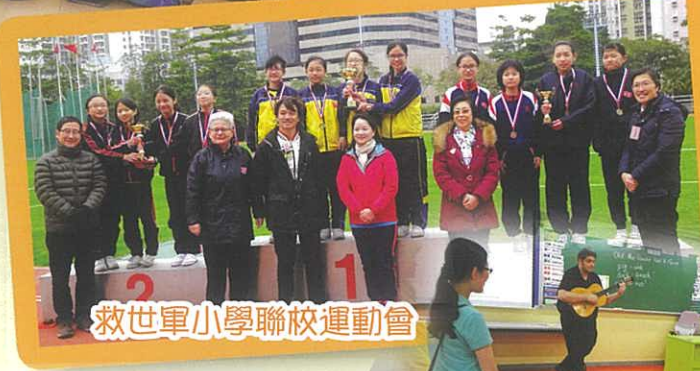
救世軍小學聯校運動會